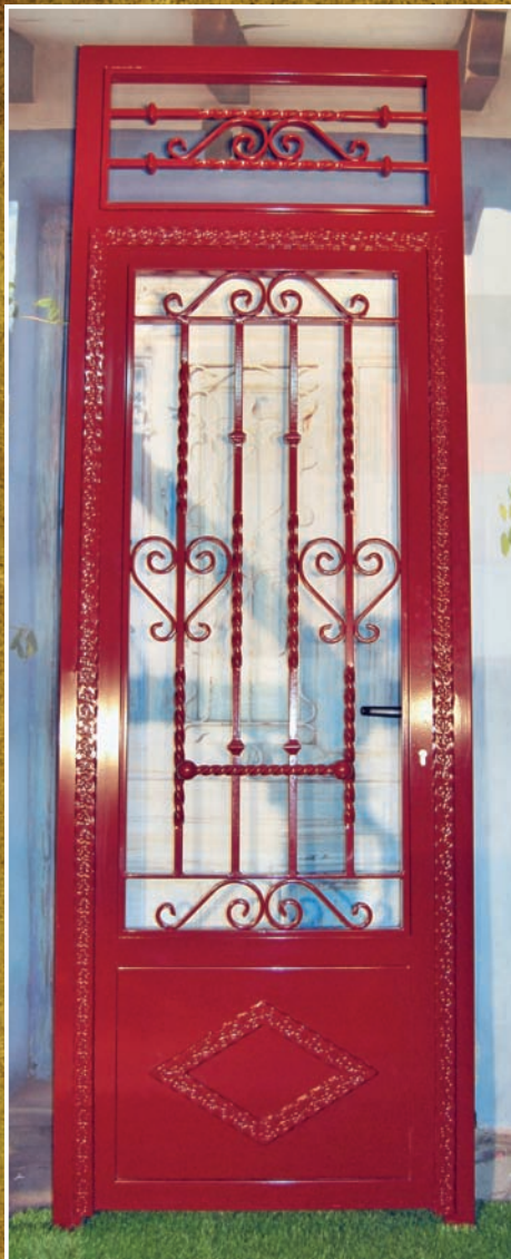
Modelo 1 - con fijo