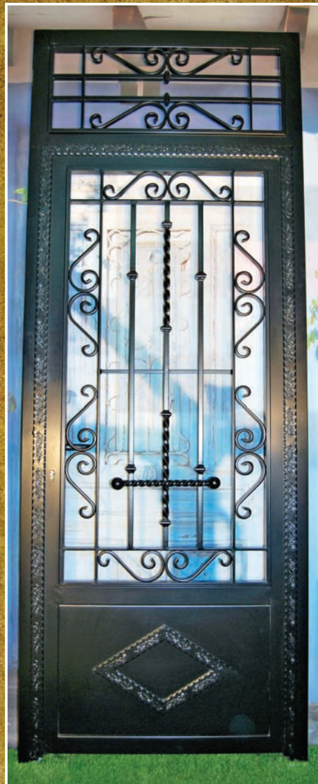
Modelo 2 - con fijo